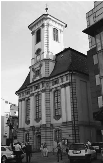
Die alte Hofkirche

Eine 15köpfige Gemeindeguppe (Hauskreis „Christ sein im Dialog“) der evangelischen Matthäuskirche Berlin-Steglitz, darunter einige Gemeindeglieder der Auen-gemeinde, hat vom 2. bis 6. Juni 2008 ihre im Vorjahr mit dem Besuch von Görlitz begonnenen schlesischen Exkursionen in Wroclaw/Breslau fortgesetzt. Sie wurde auch zu einem zweistündigen Gespräch mit dem Bischof der Diözese Wroclaw im Gemeindegemeinschaftsraum empfangen und konnte sich