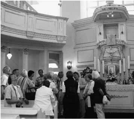
Gruppenteilnehmer in der alten Hofkirche

Ende dieses Monats alle Konfessionen musikalisch – durch gregorianische Musik, jüdische Musik usw. – im Rahmen des „Europäischen Jahrs des multi-kulturellen Dialogs 2008“ vor-stellen werden.