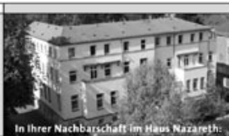
In Ihrer Nachbarschaft im Haus Nazareth: