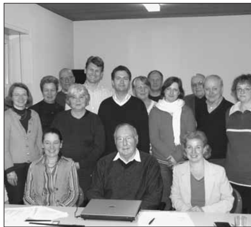
Der Gemeindegemeinderat der Matthäus-Gemeinde im März 2009