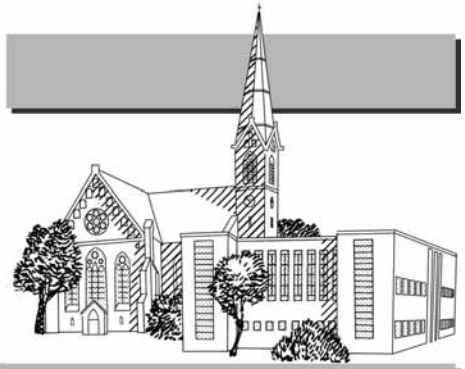
Kirchgänger auf dem Weg zur ev. Kirche von Nikolaiken (S. 5)

Gemeindeblatt der Evangelischen Matthäuskirche Berlin-Steglitz