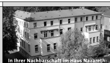
In Ihrer Nachbarschaft im Haus Nazareth: