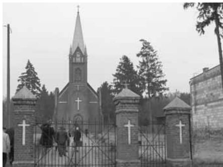
Auf dem Weg zur ev. Kirche von Nikolaiken

Vom 13.-15.3. haben wir uns mit 9 Leuten aus den Steglitzer Gemeinden