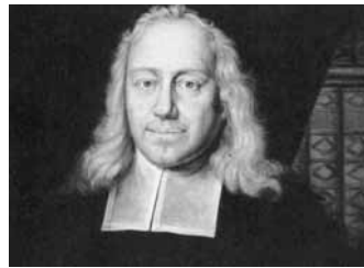
August Hermann Francke

2. Überblick über Leben und Werk von August Hermann Francke (1663-1727) und die von ihm gegründete Armen- und Waisenanstalt = die „Franckeschen Stiftungen“