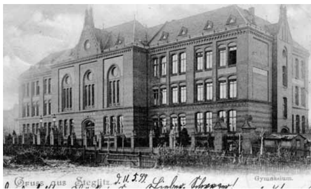
Gymnasium Steglitz

Heute wollen wir einen kleinen Spaziergang zu den Bildungstempeln im Gemeindegebiet machen und einen Rückblick auf die Schulgeschichte werfen. Wir beginnen den Ausflug an unserer Kirche. Kaum einer weiß, dass sich das erste Schulgebäude an der Schloßstraße 42 befand. 1871 wurde das Schulgebäude bezogen, die Schüler wurden vorher in Privaträumen unterrichtet. Schon 1900 wurde das Schulhaus abgerissen.