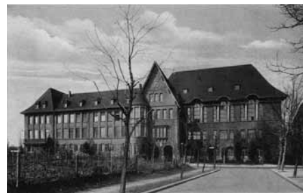
Fichtenbergschule (Foto: Sammlung Koska)

Deshalb ab in die Rothenburgstraße. An unserer Kirche vorbei, kommt man zu einem weiteren Schulkomplex. Das Areal beginnt mit dem Förderzentrum für Blinde und Sehbehinderte „Johann-August-Zeune-Schule mit der Berufsschule Dr. Silex“. Hier erhalten Blinde und Sehbehinderte ihre Ausbildung. Dabei kann man hier auch die Mittlere Reife erlangen und einen Beruf erlernen. Die an das Blindenmuseum angeschlossene Schule besuchen auch Menschen mit Mehrfachbehinderungen. Schüler, die das Abitur ablegen wollen, müssen nur wenige Schritte weiter zum Fichtenberg-Gymnasium. Gegründet wurde die