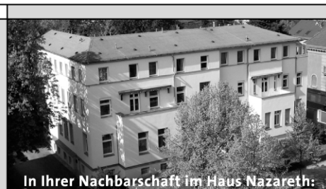
In Ihrer Nachbarschaft im Haus Nazareth: