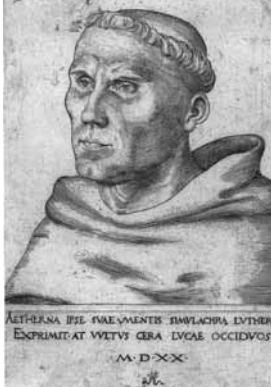
Martin Luther als Mönch