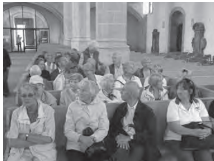
In der Stadtkirche St. Marien mit dem Grabstein von Katharina von Bora