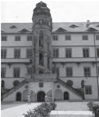
Der Große Wendelstein am Schloss Hartenfels