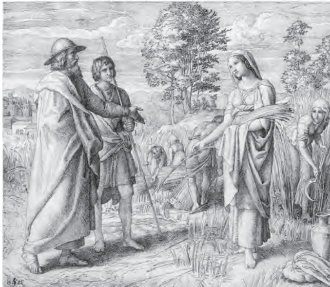
Boas und Rut auf dem Feld

Obwohl im Alten Testament sieben Prophetinnen genannt werden, begehen uns Frauen nur in Ihrer Funktion als Mütter, gehorsame Ehefrauen und heiratsfähige Töchter. Hiervon gibt es nur wenige Ausnahmen, wie die namenlosen Töchter des Zelofhads