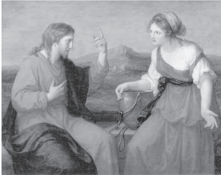
Jesus und die Samaritanerin am Jakob-Brunnen

losen Samaritanerin am Jakob-Brunnen ist ein aufschlussreiches Beispiel für sein Frauenbild. Das Gespräch zeigt seine Offenheit, Ehrlichkeit und Zuneigung gegenüber einer von Juden verachteten Person. Die Samaritanerin erkennt Jesus als ihren persönlichen Erretter: „Kommt, seht einen Menschen, der mir alles gesagt hat, was ich getan habe, ob er nicht der Christus sei!“ Am Ende des Dialogs steht die Erkenntnis der Samaritanerin, den Messias gefunden zu haben. Der Messias wird also von einer Frau erkannt, die fünf Männer gehabt hatte, und einer Religionsgruppe entstammte, die den Juden als Ketzer galt, weil sie nur die ersten fünf Bücher Mose als Heilige Schrift anerkannte. Und wie reagieren seine Jünger? – „Sie wunderten sich, dass Jesus mit dieser Frau sprach.“