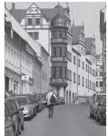
Erker des Rathauses