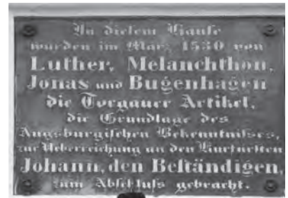
Gedenktafel an der ehemaligen Superintendentur