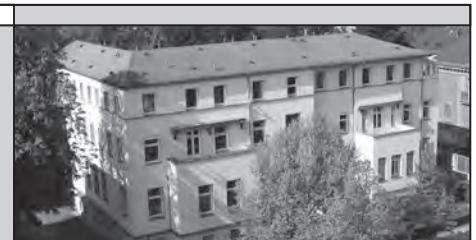
In Ihrer Nachbarschaft im Haus Nazareth: